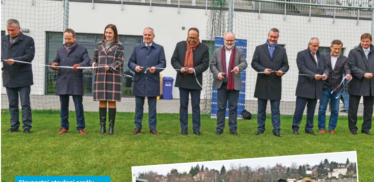
Slavnostní otevření areálu 2. prosince.