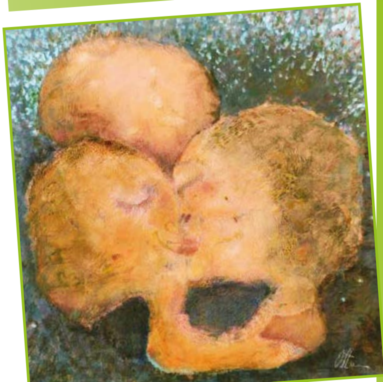
Oldřich Harok - Polibek. Olej na sololitu.