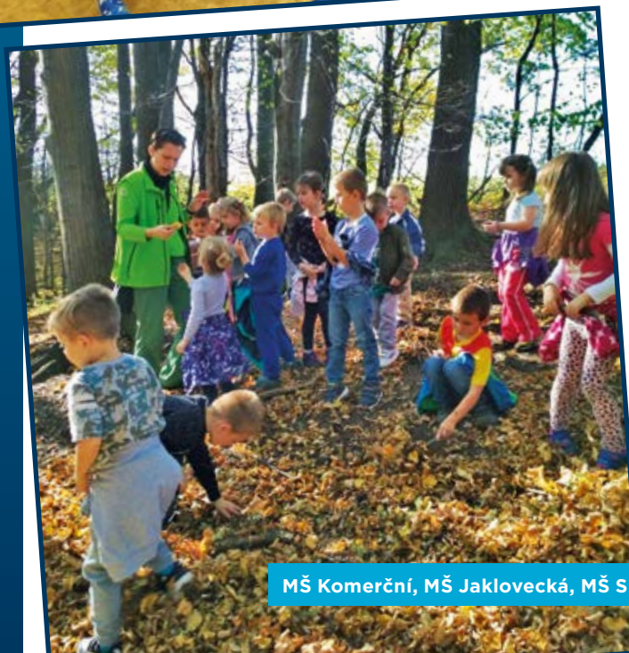
MŠ Komerční, MŠ Jaklovecká, MŠ Slívova