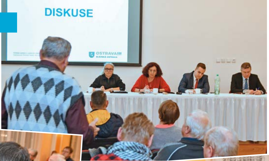
Setkání v Muglinově.