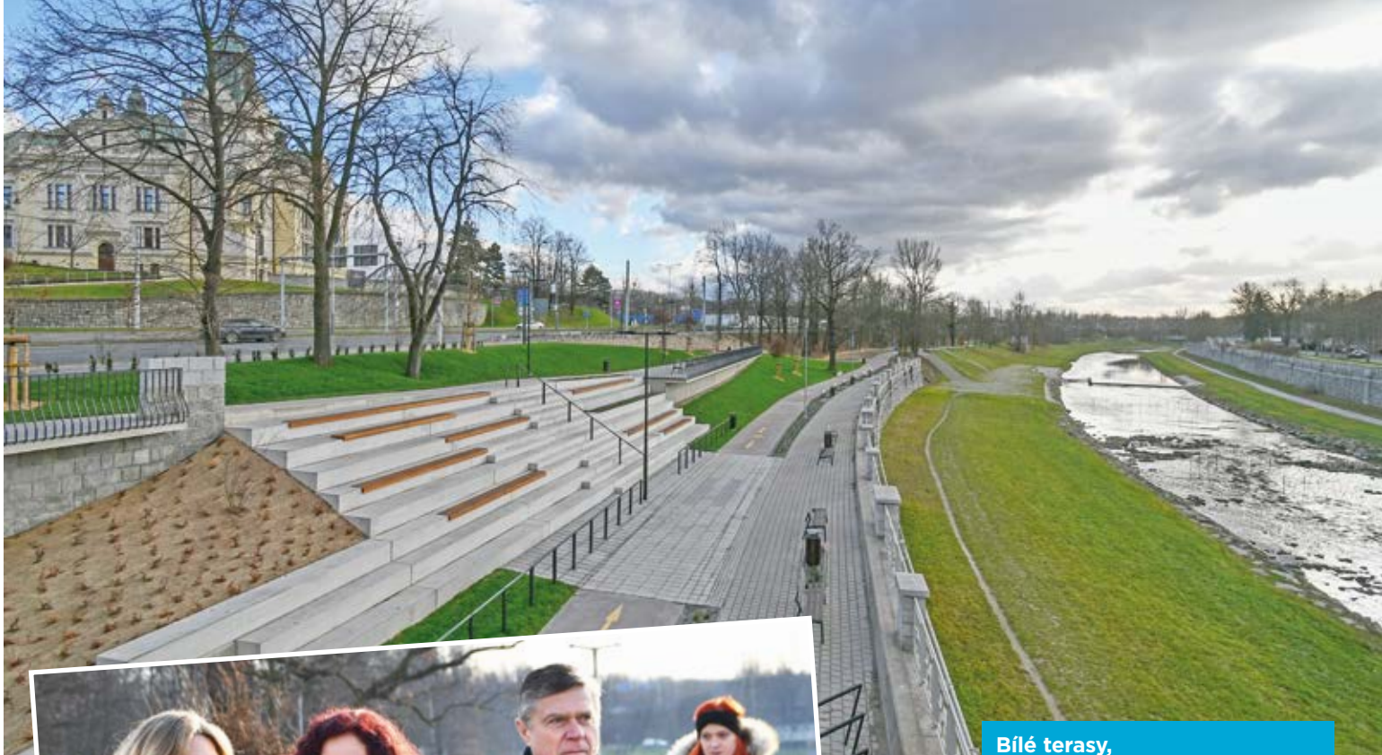
Bílé terasy, nová ozdoba Slezské Ostravy.