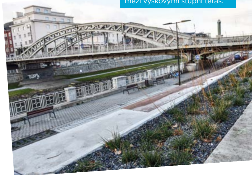
Nová výsadba mezi výškovými stupni teras.