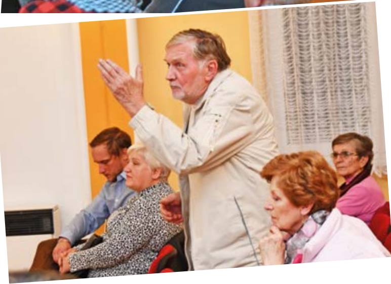
Setkání v Heřmanicích.